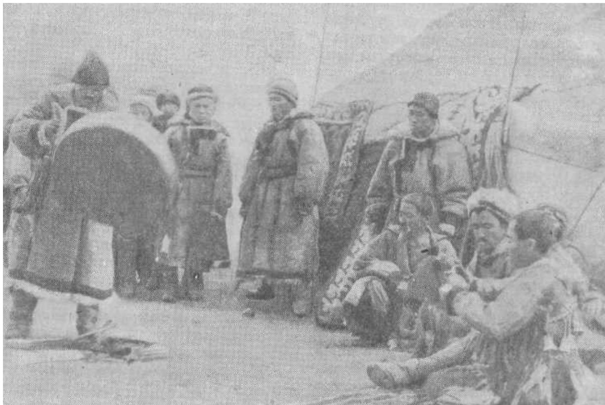
Заклинания шамана. Алтай.