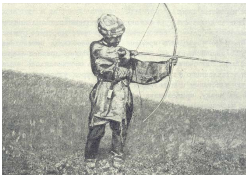
Фиг. 3. Лук для охоты на бурндуков.

Следующую категорию составляли облавщики и низшую — военнопленные рабы, выполнявшие наиболее тяжелую и черную работу. Перед началом и после охоты главный шаман устраивал моление охотничьим духам, держа в руках стрелу. Главный шаман руководил дележом добычи, из которой часть поступала в общественный фонд (һан), находившийся в заведывании главного шамана. Из этого фонда часть мяса предназначалась для жертвоприношения. Лучшая же часть мяса и шкура зверей при дележе отклады-