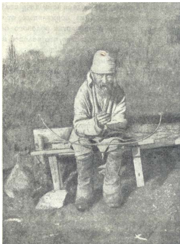
Фиг. 2. Моление с луком.

На основании изучения роли лука и стрелы мы высказали предположение об одном конкретном пути образования шаманов у алтайцев, в том числе, разумеется, и у шорцев, которое мы намерены здесь привести полностью.