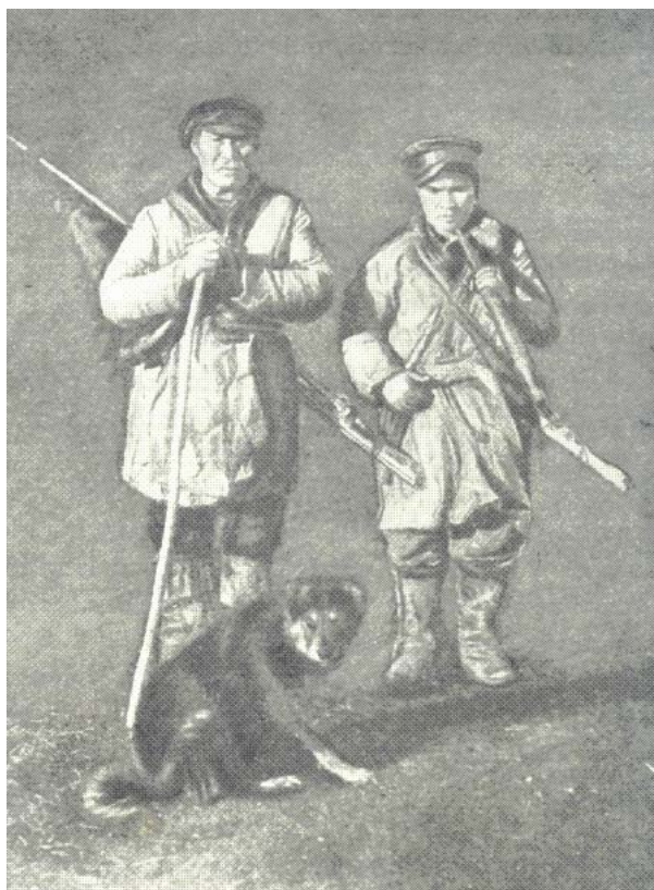
Фиг. 1 Охотники шорцы

бался от 2 до 6 человек. В возрастном отношении артель была также разнообразна. В нее входили и старики, не принимавшие иногда непосредственного участия в охоте, и подростки, которые еще учились стрелять. При разделе добычи все наделялись равным паем. Продукты и огнестрельные припасы заготавливались заранее. Огнестрельные припасы в некоторых артелях покупались сообща и составляли достояние всей артели. Остатки их после охоты делились поровну. У шорцев, живущих в бассейне р. Кондомы, продукты питания каждый приобретал самостоятельно. Посуда и котелок для еды у каждого были свои. Объясняли это поверьем, якобы „охотничье счастье" (ыгъз) каждого охотника находится в котелке. Поэтому в целях безраздельного обладания „счастьем" каждый должен был пользоваться только своим котлом и только отец и сын, не находящиеся в разделе, могли иметь один котелок. По существу же данное поверье отражало материальную обособленность производителей, которые объединялись в артели лишь на короткий срок, а на деле вели индивидуальное мелкое хозяйство. На ряду с этим у шорцев верховьев р. Мрассы мы имели возможность зафиксировать общность питания охотников на промысле. Из одного котла питались по два и по три охотника.